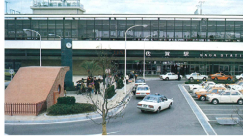
佐賀駅の変遷(佐賀市史第5巻より引用)