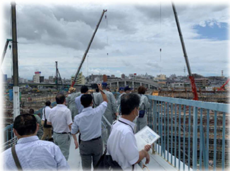
SAGAサンライズパーク